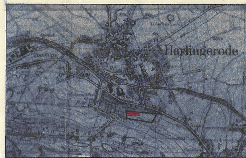
ÜBERSICHT MASSTAB 1:25 000